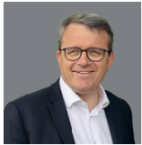
François Durovray Ministre délégué aux transports Président de la Communauté d'Agglomération Val d'Yerres Val de Seine