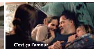
C'est ça l'amour