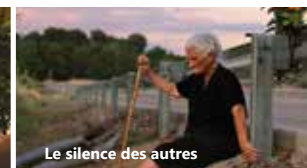
Le silence des autres