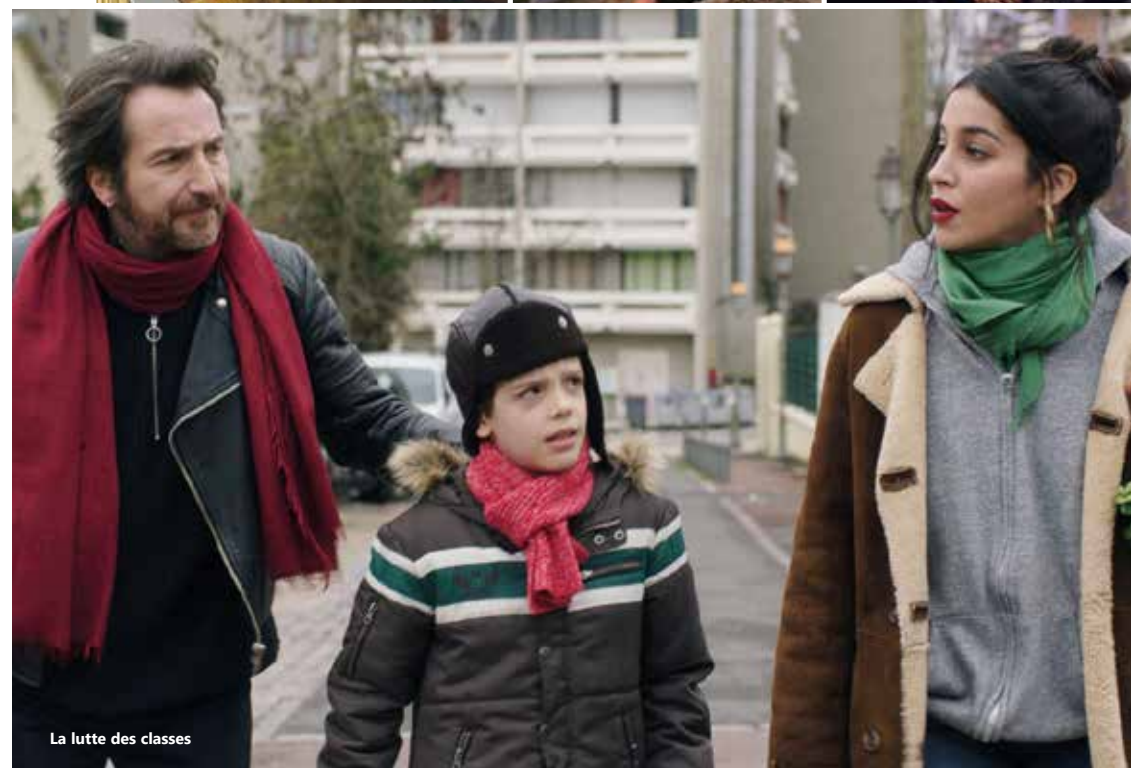
La lutte des classes