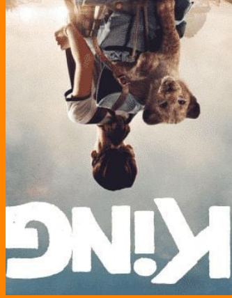
K!NG À partir de 6 ans France - 2022 - 01H45 De David Moreau Avec Gérard Darmon, Lou Lambrecht, Léo Loréach King, un lionceau destiné à un trafic, s'échappe de l'aéroport et se réfugie dans la maison d'Inès, 12 ans et Alex, 15. Le frère et la sœur ont alors l'idée folle de le ramener chez lui, en Afrique. Mais la traque des douaniers ne leur facilite pas la vie. Lorsque Max, leur grand-père fantasque qu'ils n'ont vu que deux fois dans leur vie, se joint à l'aventure, tout devient possible.