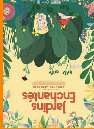
JARDINS ENCHANTÉS À partir de 3 ans France - 2022 - 45mn Dans une clairière, au milieu des hautes herbes ou dans le verger du roi se cachent des mondes merveilleux : jardins envoûtants et forêts foisonnantes révèlent souvent de magnifiques secrets... À l'abri des regards, les insectes, les oiseaux et même les enfants vivent des aventures extraordinaires !