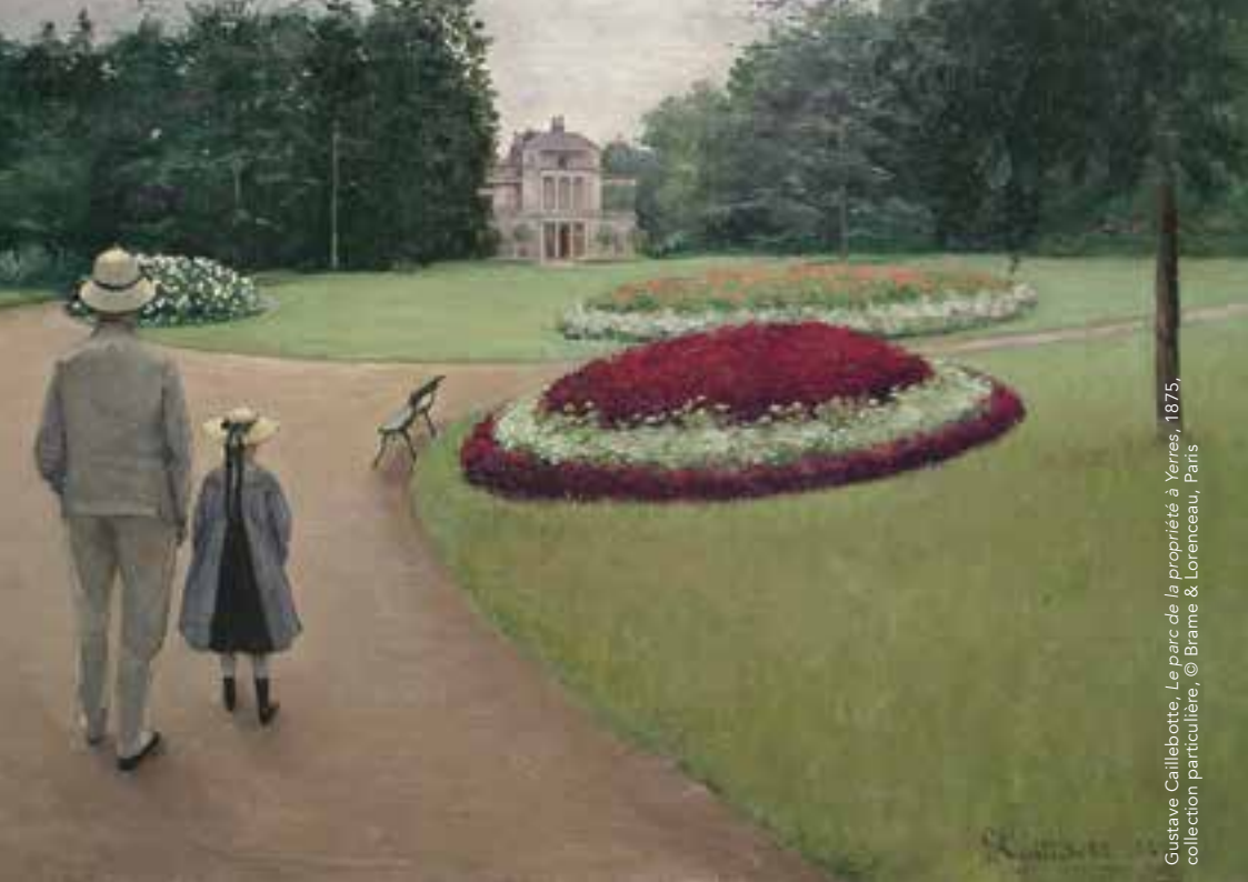
Gustave Caillebotte, Le parc de la propriété à Yerres, 1875 , collection particulière, © Brame & Lorenceau, Paris