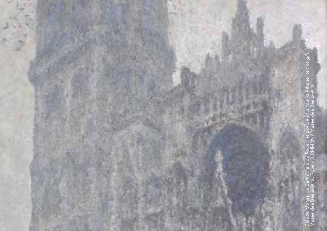
Claude Monet, La Cathédrale de Rouen, le portail et la tour d'Albane, temps gris, 1894. Musée des Beaux-Arts, Rouen