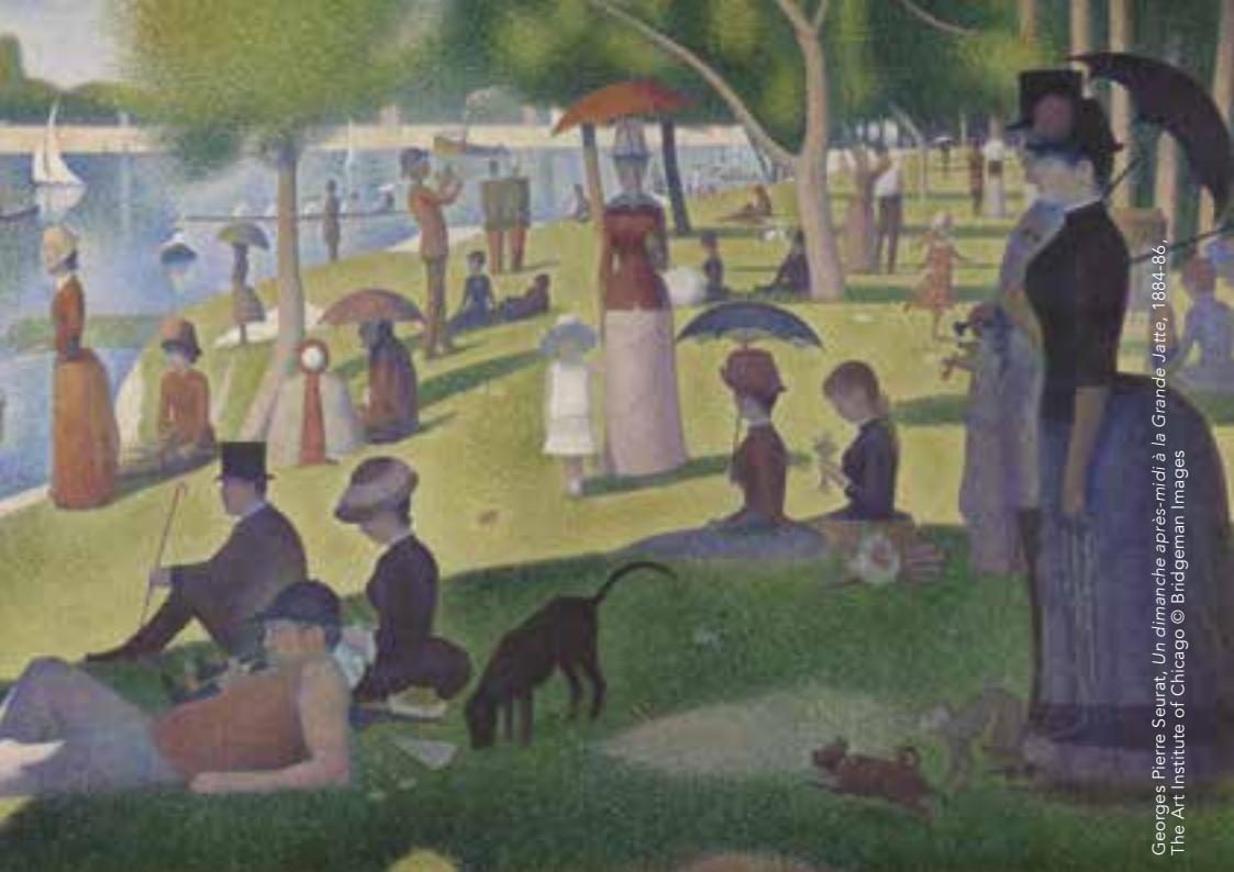
Georges Pierre Seurat, Un dimanche après-midi à la Grande Jatte , 1884-86, The Art Institute of Chicago