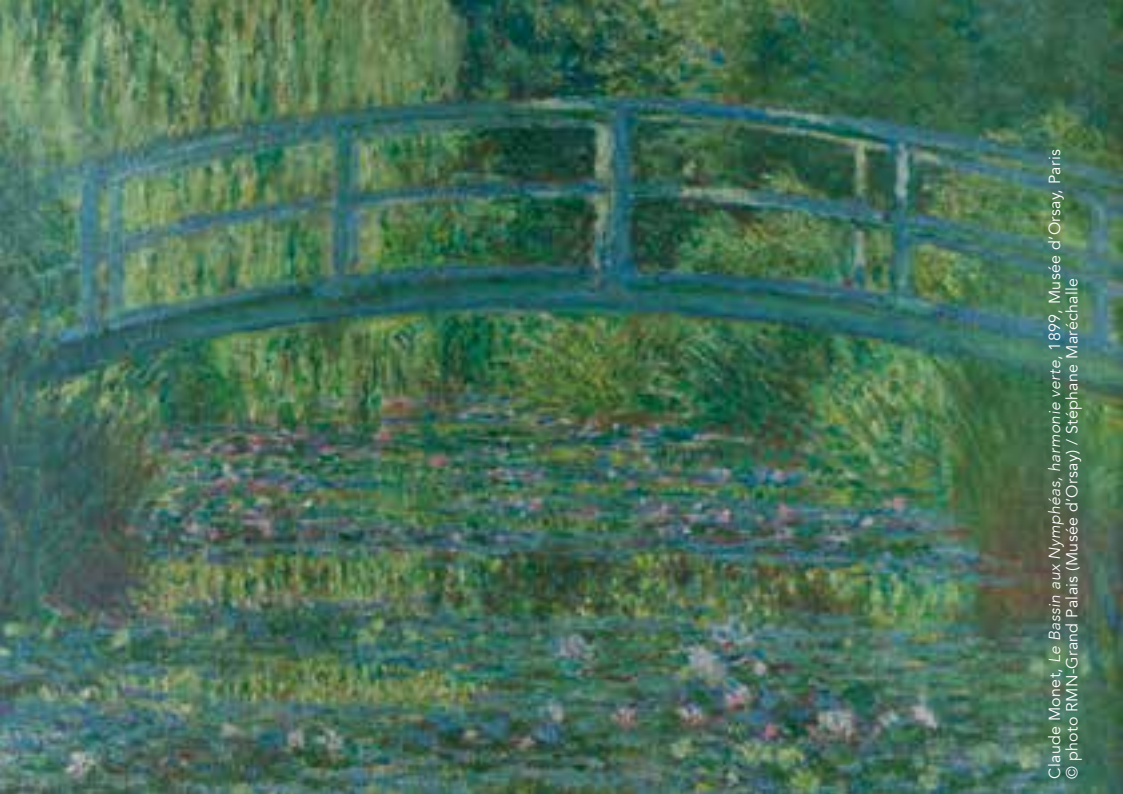
Claude Monet, Le Bassin aux Nymphéas, harmonie verte , 1899, Musée d'Orsay, Paris