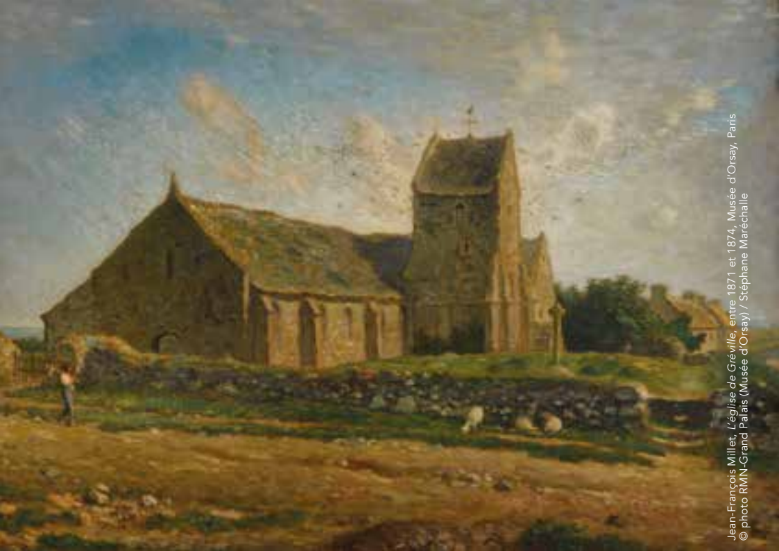
Jean-François Millet, L'église de Gréville , entre 1871 et 1874, Musée d'Orsay, Paris