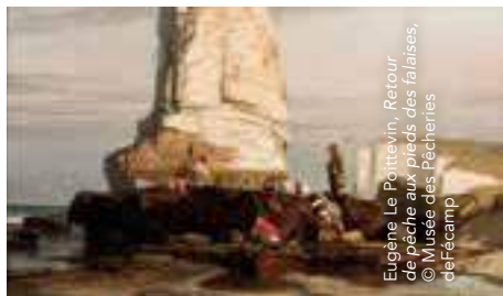
Eugène Le Poittevin, Retour de pêche aux pieds des falaises, © Musée des Pêcheries de Fécamp

Avec sa côte découpée et ses falaises, Fécamp constitue un port d'attache pour les peintres de plein-air. Monet et Berthe Morisot y ont trouvé de nombreux motifs d'inspiration pour leurs œuvres, et Eugène Delacroix a séjourné à plusieurs reprises à Valmont, non loin de Fécamp. Dans son bâtiment superbement rénové et surmonté d'un vertigineux belvédère, le musée des Pêcheries ouvre ses cimaises à Eugène Le Poittevin, l'un des précurseurs de l'Impressionnisme. Cette exposition montre comment, réunissant autour de lui un vaste cercle d'artistes, il a contribué à « inventer » Étretat comme station balnéaire mondaine et site majeur de la peinture de plein air au tournant du XIX e siècle.