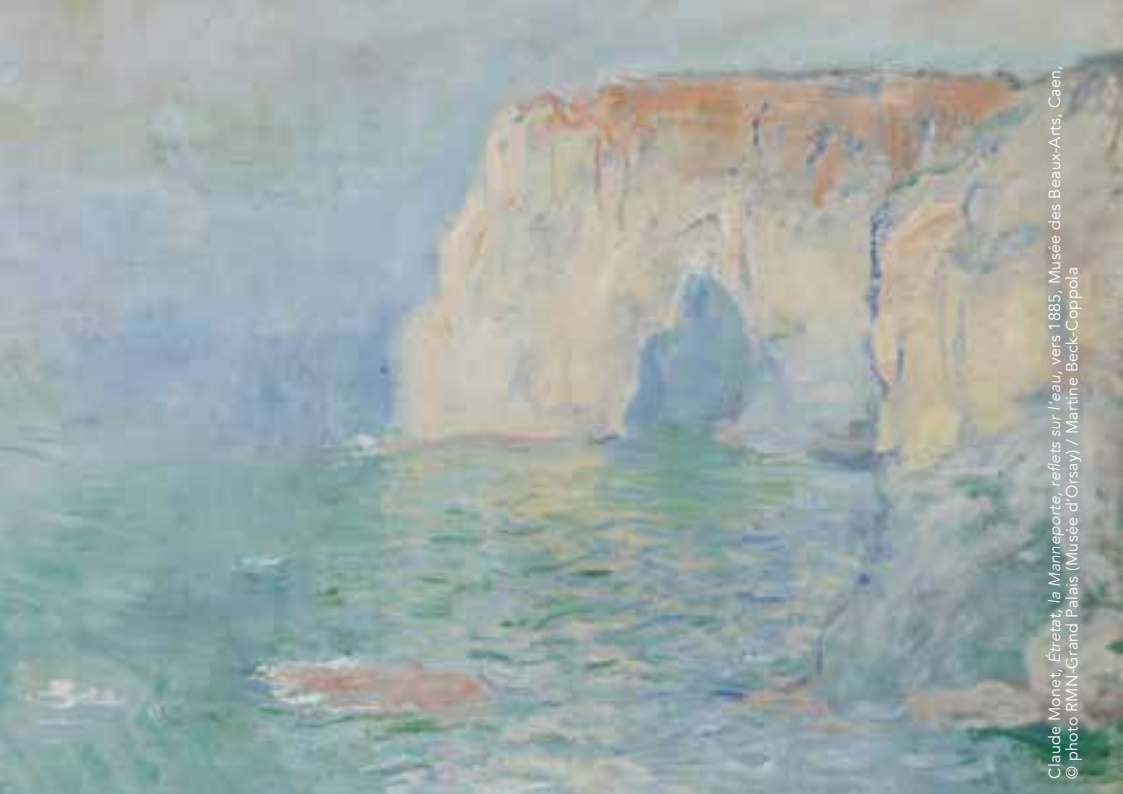
Claude Monet, Étretat, la Manneporte, reflets sur l'eau , vers 1885, Musée des Beaux-Arts, Caen