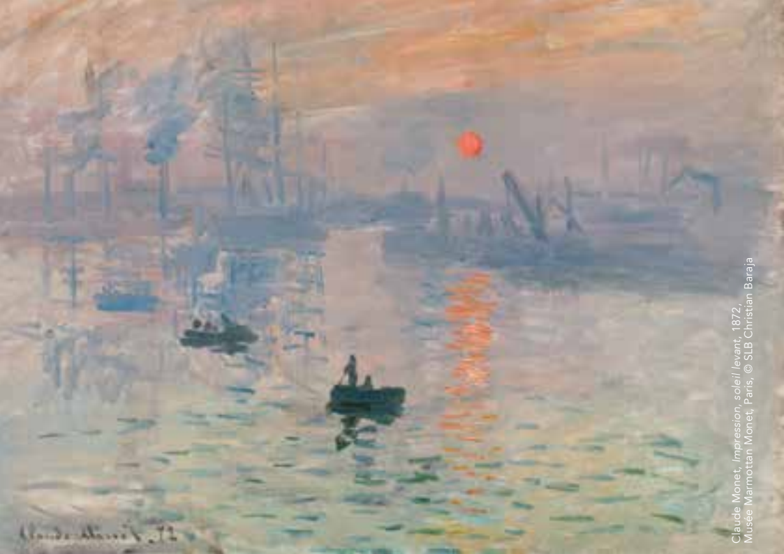
Claude Monet, Impression, soleil levant, 1872. Musée Marmottan Monet, Paris