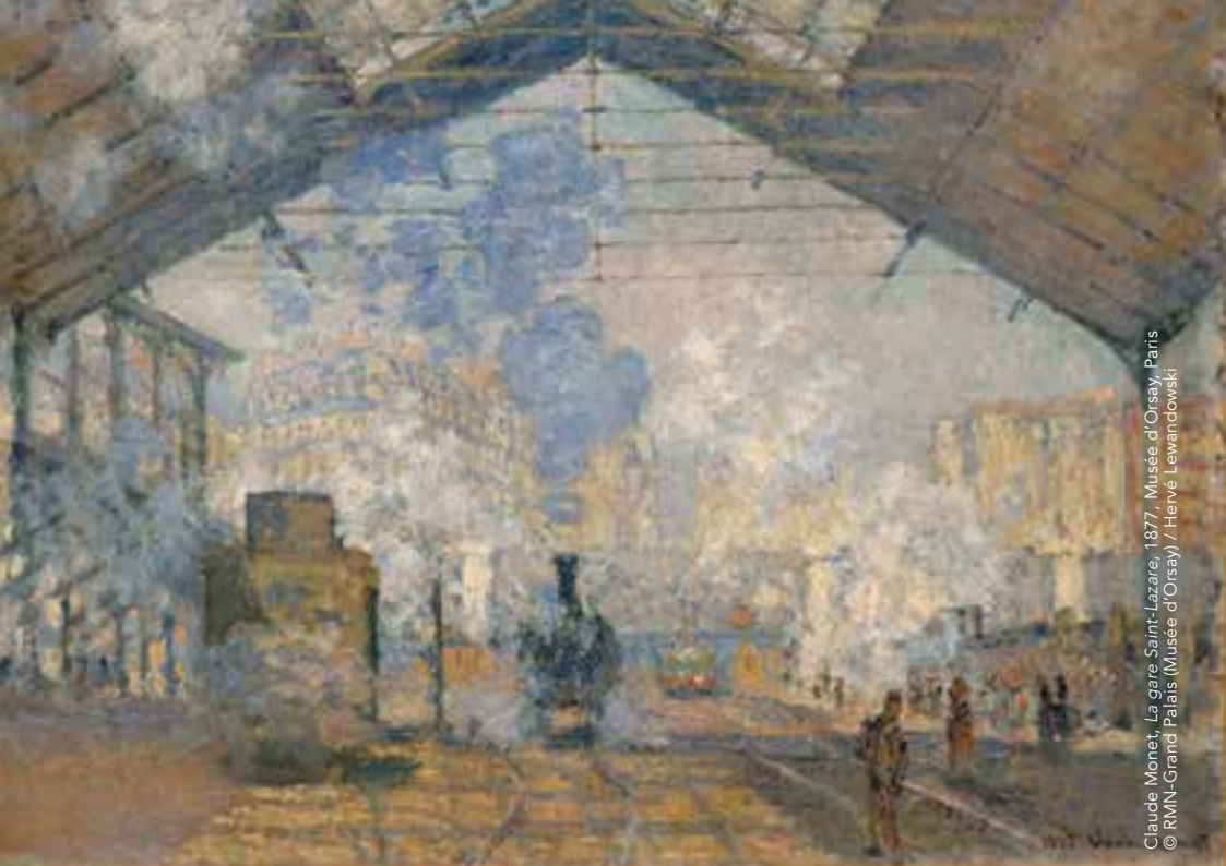
Claude Monet, La gare Saint-Lazare, 1877, Musée d'Orsay, Paris