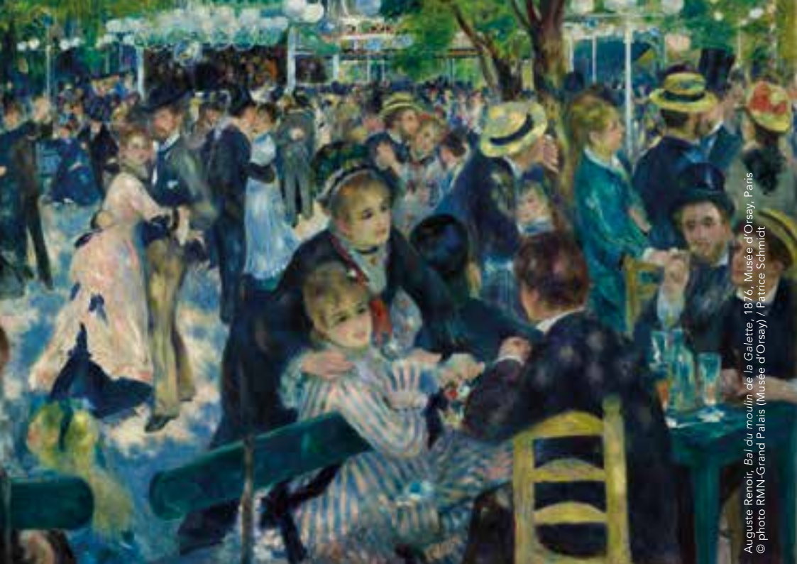
Auguste Renoir, Bal du moulin de la Galette, 1876, Musée d'Orsay, Paris