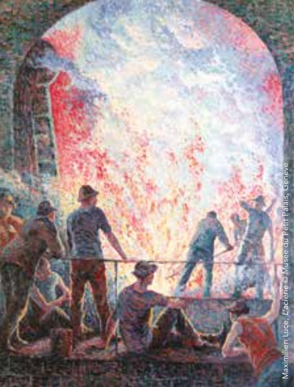
Maximilien Luce, L'aciérie