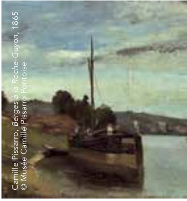
Camille Pissarro, Berges à la Roche-Guyon, 1865