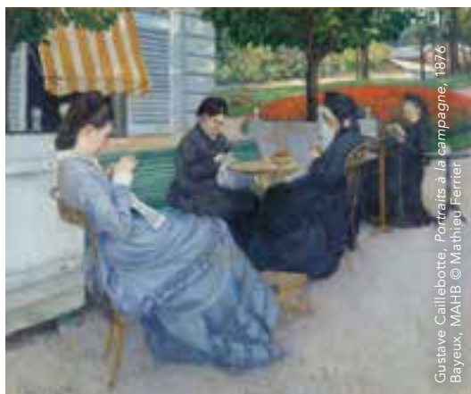
Gustave Caillebotte, Portraits à la campagne, 1876 Bayeux, WAHB

Ce musée invite à un véritable voyage au cœur de l'histoire de l'art européen. Les collections installées au sein d'un splendide palais épiscopal accordent une place de choix aux Impressionnistes. À ne manquer sous aucun prétexte : des tableaux de Boudin, et depuis cette année, deux toiles de Caillebotte : Portraits à la campagne et Paysage à Argenteuil . Ces deux tableaux ont été offerts par Gustave Caillebotte à sa cousine Zoé, qui a « hérité » de Portraits à la campagne lors de son mariage à Bayeux.