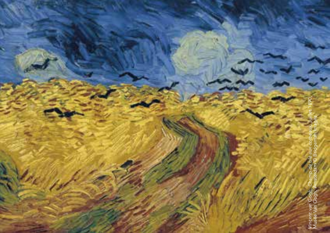
Vincent van Gogh, Champ de blé aux corbeaux, Juillet 1890, Musée Van Gogh, Amsterdam