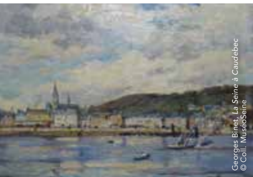
Georges Binet, La Seine à Caudebec